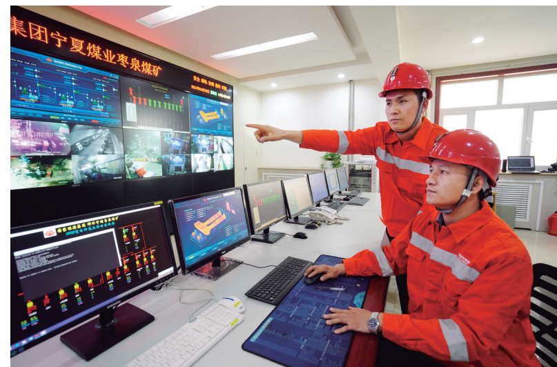
职工应用智能数据分析技术对井下供电供水设备进行远程监控。