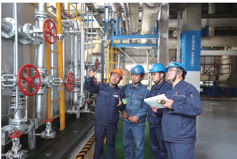
劳模创新团队成员在装置现场探讨技改方案。