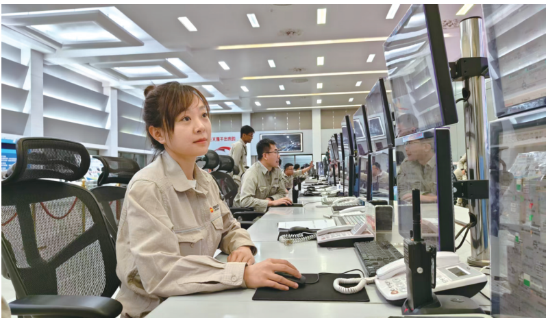
烯烃一公司丙烯车间甲醇制丙烯岗副操谷钥专注地调整设备运行参数,确保装置安全运行。