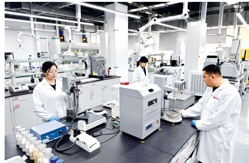
研发人员进行α-烯烃分离工艺实验。