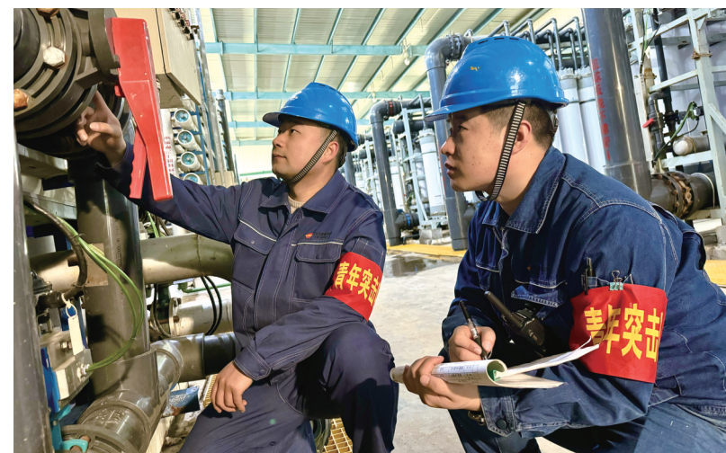
青年突击队成员积极参与除盐水工艺凝液技改,实现余热回收再利用。