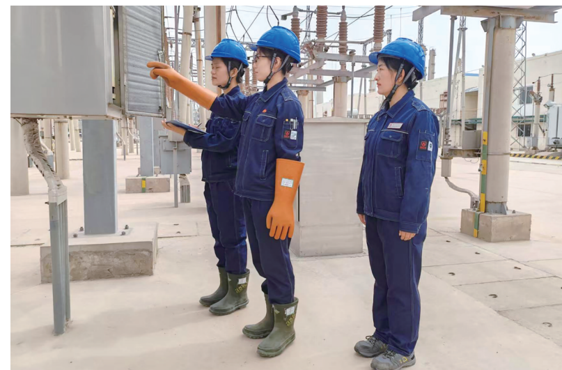
甲醇分公司电气车间运行班女工进行设备倒闸操作,确保送电安全。