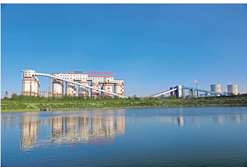
宁煤职工镜头中的绿色矿区。