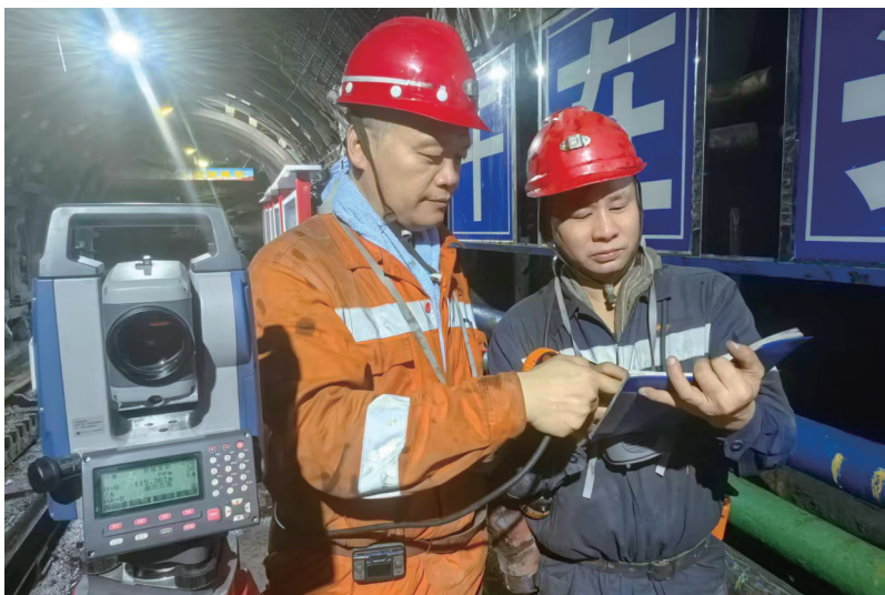
职工复测井下回风巷道参数。