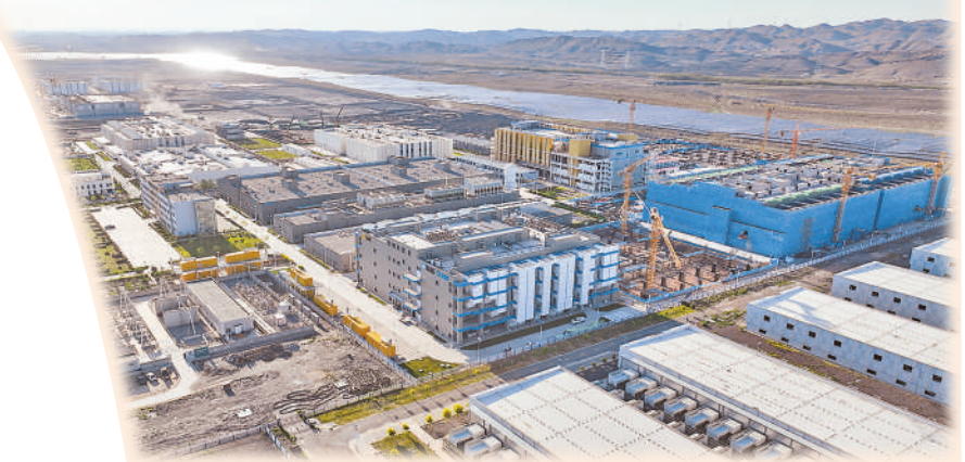
工业园区“东数西算”数据中心。

为实现这一目标，中卫市将加快建设跨区域大容量骨干直连链路，落地成形面向全国的20毫秒算力时延圈。做大上下游配套，引进更多头部企业、部委、央企智算中心和备份中心布局中卫市，稳步培育硬件制造、词元工厂、数据标注等算力及关联业态；纵深推进数实融合，实施“人工智能+”“数据要素x”行动，推进智改数转，不断壮大智慧文旅、农村电商等新业态。加快布局商业航天等新兴产业，构建“卫星研制—数据接收—处理应用”全产业链。