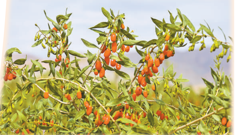
红彤彤的枸杞挂满枝头。

亮城市名片，让更多游客在中卫市邂逅美景、感受文化、留住乡愁。将高标准推进海市蜃楼、沙漠传奇等重点文旅项目，精心打造沙漠美术馆、沙漠天文馆等特色地标；深耕星空文旅赛道，完善天文观测、星空摄影、星空度假全链条产品，打造全国顶级综合性星空旅游目的地。常态化举办沙漠音乐节、越野赛等特色文体活动，让沙漠、星空、运动成为中卫市最鲜明的文旅标识。