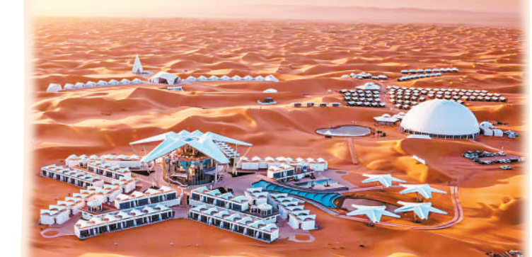
星星酒店美轮美奂。

荒”大基地和“西电东送”起点城市定位，系统布局，一体构建新型能源体系。持续建强骨干电网，全力推进南湾750输变电工程及沙坡头330千伏变电站扩建。加快抽水蓄能等多元储能项目建设，力争储能装机规模达到700万千瓦。大力推行源网荷储一体化、绿电直连等新模式。到2030年，新能源装机容量力争突破3000万千瓦。打造新型能源装备制造集群，引进塔筒、发电机等配套产业，推动风电整机、轮毂、叶片等全链条发展。