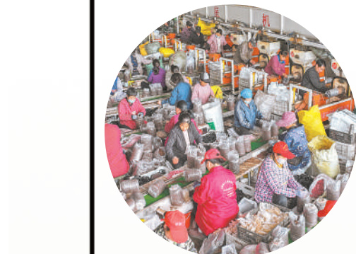
宁夏玉禾清农业开发有限公司的菌棒制作车间。