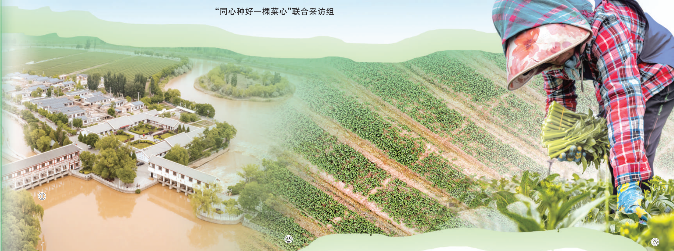
①青铜峡地处宁夏引黄灌区及银川冲积平原的核心地带(唐正渠和汉渠交汇处)。 ②菜场进行喷淋浇水。 ③正值丰收季,来自贵州的“菜客”们在田间地头采收菜心(宁夏青盛丰农业科技有限公司菜场)。