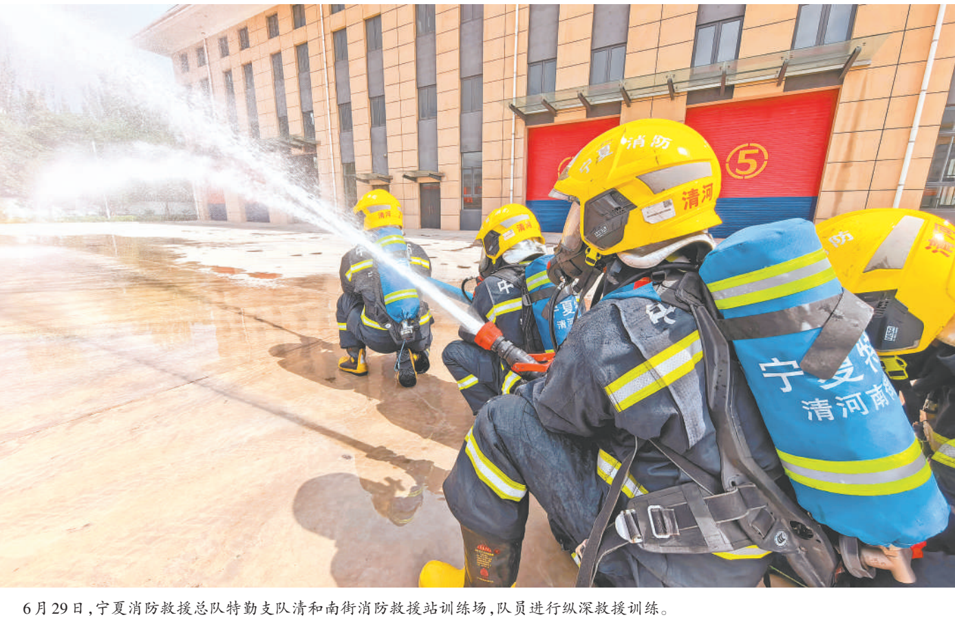
6月29日,宁夏消防救援总队特勤支队清和南街消防救援站训练场,队员进行纵深救援训练。