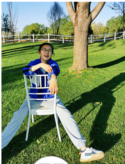
希望你永远无忧无虑。