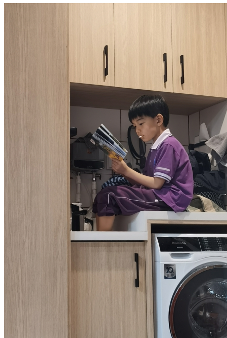
脚泡在爸爸的洗脸池里,含着棒棒糖惬意地看着故事书。