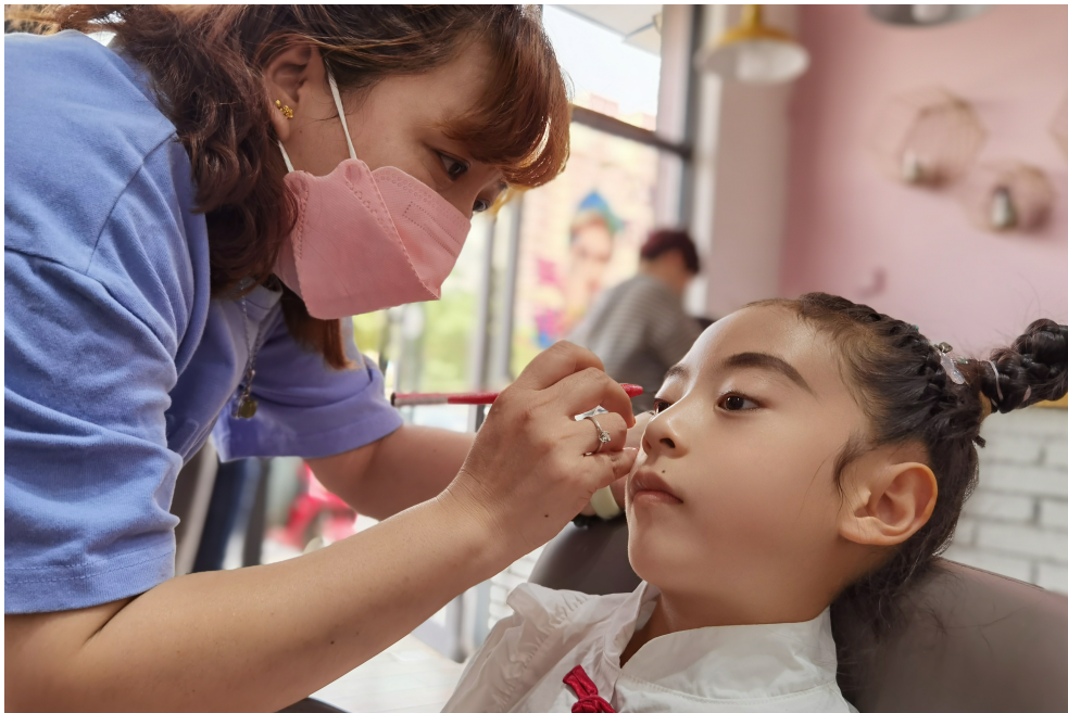
化个淡妆,参加六一儿童节汇演。