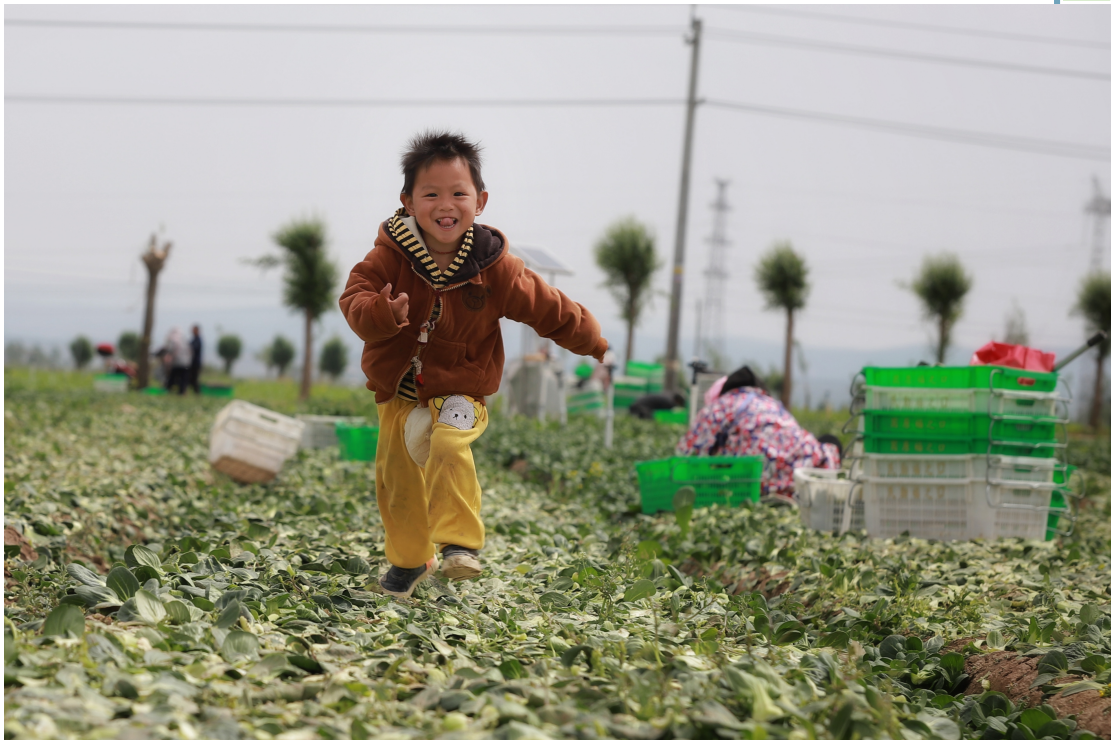
蔬菜基地郁郁葱葱,成了孩子的乐园。@一朵云 摄