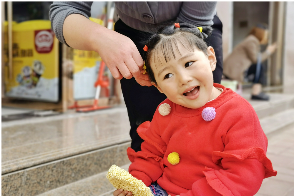
满头小辫是小女孩的标配。