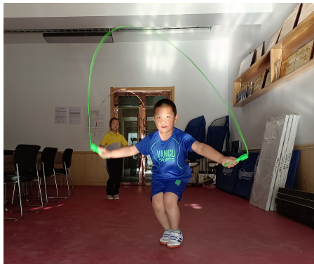
认真练跳绳。

六一儿童节还未到来,社交媒体上就已出现各种晒娃的照片,新报拍客摄影师们也发来了一组照片,孩子们天真的笑容,调皮的瞬间,让人会心一笑的同时,一种美好的感觉油然而生。这可能也是拍摄者想表达的吧,希望孩子们永远快乐!