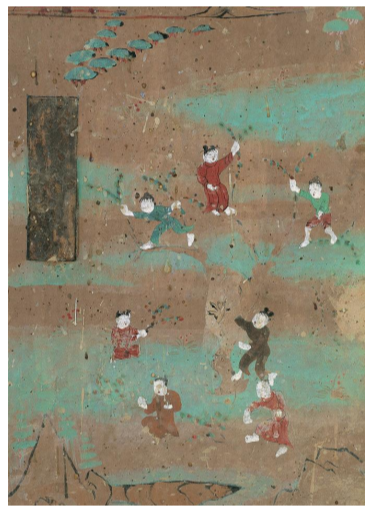
莫高窟第112窟中的中唐时期壁画,反映的是古代儿童游戏“群童采花”。