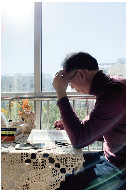
看书学习，不负好时光。