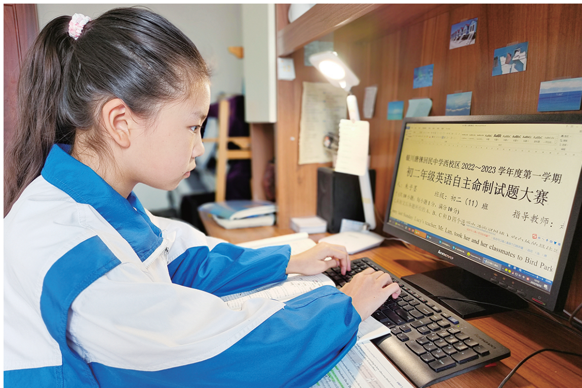
孩子要出一份试卷，这认真严谨的样子就像个小老师。

家是温暖的港湾，照片是有温度的记忆。宅在家的日子，多给家人拍些照片吧，留存更多不经意间的“小美好”。