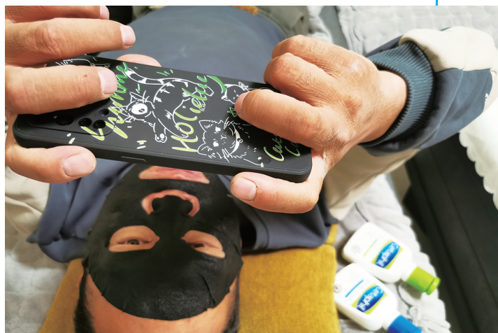
抽空敷个面膜，爱美总是没错的。