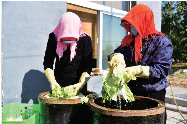
腌点大白菜，准备过冬。