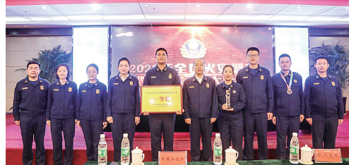
勇夺全区火灾调查暨新闻宣传大比武桂冠。