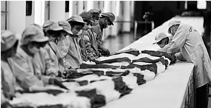
神舟飞船伞包现场。

成功来之不易,降落伞研制的背后需要经历 30 个制作工序、20 多个包装工序和 40 多个装配工序。这项巨型降落伞是怎样“诞生”的?又是如何做到收拢后装进伞包内的体积还不到 200 升、可以塞进普通家用冰箱的?记者带您一探究竟。