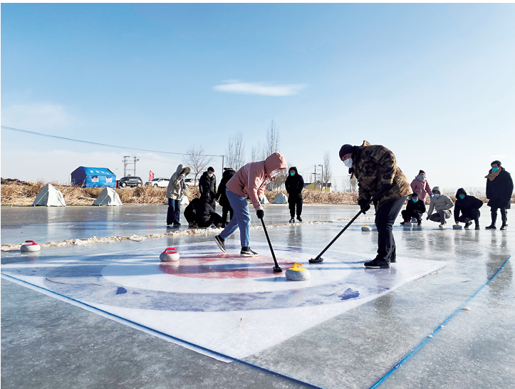
游客在体验冰壶项目。