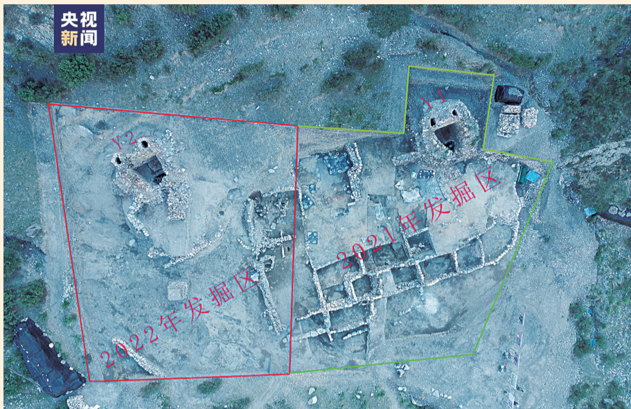
2021年、2022年发掘区航拍图。

本报讯（记者 张雪梅）2月15日上午，国家文物局在北京召开2023年第一季度“考古中国”重大项目重要进展工作会，发布的5项重要考古成果分别来自河北、云南、甘肃、宁夏和内蒙古，揭示了从距今上万年的新石器时代到宋元时期的丰富文化遗存，宁夏贺兰苏峪口瓷窑遗址在列。