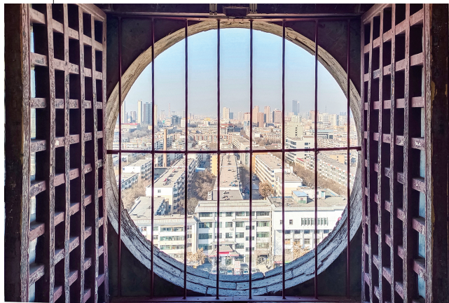
古今之别。@流浪凡子 摄

视觉,内心五味杂陈;在钟书阁里读书、选书,仪式感爆棚;行走在简约的艺术馆走廊,美在其中;市民大厅正堂和高楼大厦的玻璃幕墙,散发着浓浓的现代建筑味道。