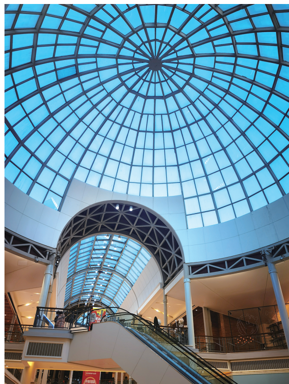
很有视觉张力的购物中心屋顶。