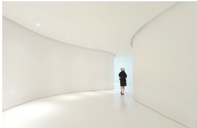
每次逛艺术馆,都会因美而感动。