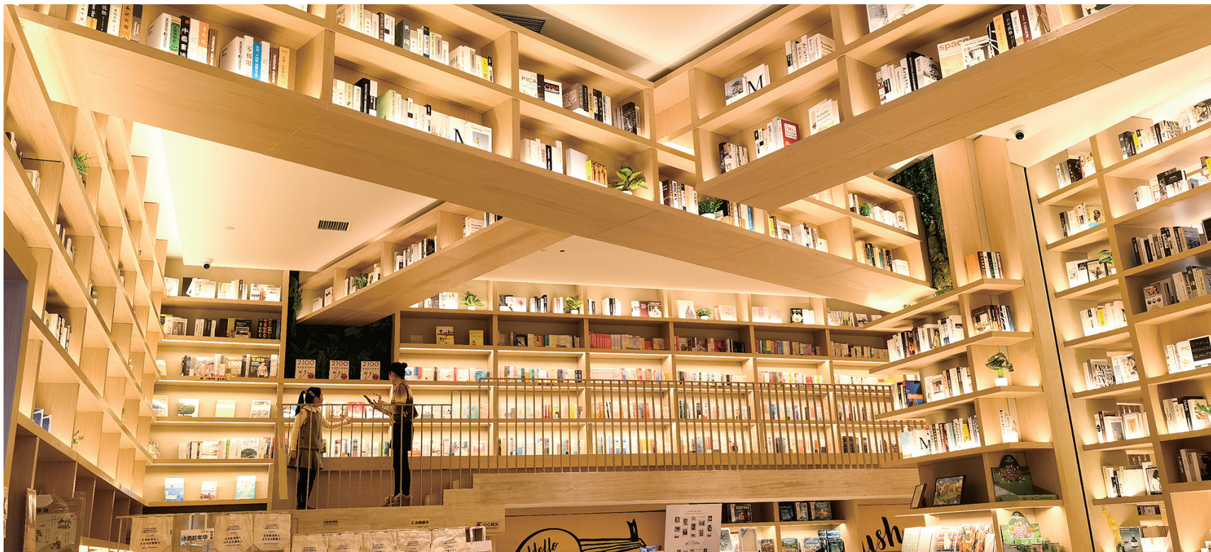
钟书阁特别的设计,沉浸其中,是种享受。