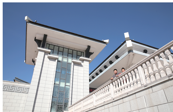
博物馆一角。