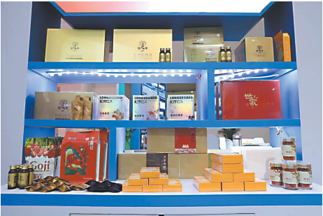
展台商品琳琅满目。

本报讯（记者 张雪梅）3月18日，为期3天的“2023中国跨境电商交易会”（以下简称跨交会）在福建省福州市拉开帷幕，银川市组团参展。作为国内首个大型跨境电商垂类专业展，本届跨交会由商务部外贸发展事务局、福建省进出口商会等单位主办，以“链接跨境全流域、共建电商新生态”为主题，设立跨境电商供货商、平台、综合服务商、独立站等展区，参展商达2000余家。 银川跨境电商综合试验区形象馆是凤凰展翅造型，蓝黄绿的整体色调既体现了银川市“凤凰城”的风貌，也展示出黄河流域生态保护和高质量发展先行区的美好图景。“银川馆”集中展示了银川跨境电商综合试验区整体发展情况、产业园区建设、产业优势，同时对银川特色产品进行宣传推介。展区现场，枸杞原浆、黑果枸杞、枸杞干果等枸杞系列产品，贺兰山东麓葡萄酒、亚麻籽油、八宝茶、活性炭等优势特色产品吸引了不少跨境电商企业的目光，“银川造”“银川品牌”引起国内外参观人员的浓厚兴趣。