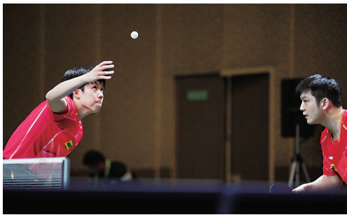
←5月23日,樊振东/王楚钦(左)在比赛中。