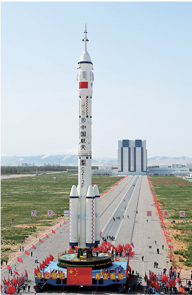
5月22日,神舟十六号载人飞船与长征二号F遥十六运载火箭组合体在转运途中。

“计划今年年底前完成全部选拔工作。”林西强说,如果港澳地区的候选对象通过复选和定选,可于明年初进入航天员科研训练中心。