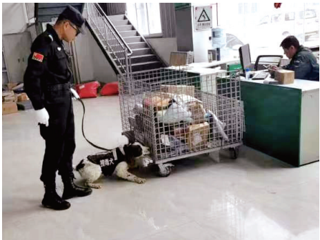
训导员指挥缉毒犬对快递包裹进行嗅识、嗅辨。

本报讯 为深入推进“清源断流”专项行动，进一步加强和规范物流寄递行业禁毒安全管理工作，严厉打击物流寄递渠道涉毒违法犯罪活动，5月23日至24日，西吉县公安局禁毒大队联合西吉县禁毒办、西吉县商务和工业信息化局、西吉县公安局刑侦大队警犬中队对物流寄递行业开展禁毒“专项检查+宣传”工作。