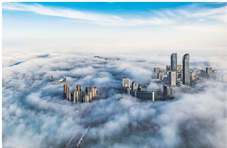
银奖作品：《雾海漫漫凤凰城》组照之一 作者：夏承理