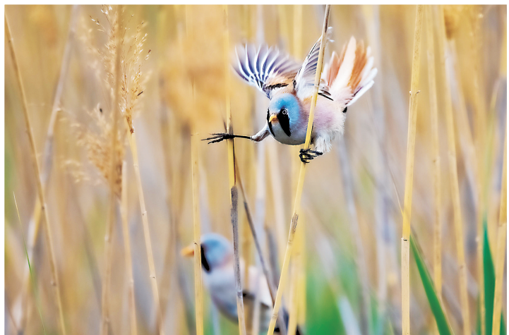
铜奖作品：《文须雀》组照之一 作者：白国华