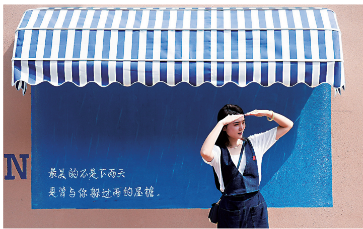
铜奖作品：《漫游兴庆》组照之一

从展出的照片可以看出，生态环境逐步向好，美景大片日益增多，摄影师们思考式的创作也丰富多彩，使得作品内容“琳琅满目”。