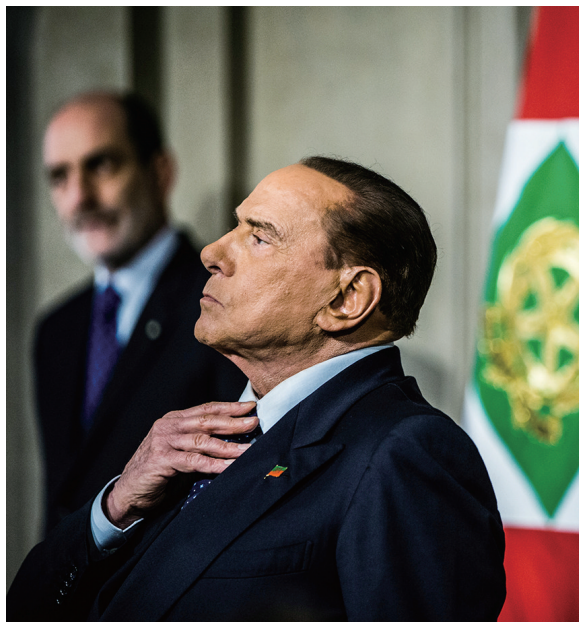
这张资料照片显示的是,2018年4月12日,意大利前总理贝卢斯科尼在罗马出席记者会。