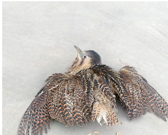
受伤的大麻鳎。

本报讯（记者 吴彩华）6月24日，石嘴山市公安局惠农区分局红果子派出所民警及时救助了一只国家“三有”保护动物大麻鳎（jiān），并将其送至宁夏贺兰山国家级自然保护区管理局。