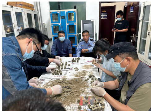
警方追回的宋代古钱币。

6月15日，经贺兰县人民检察院批准，7人被执行逮捕。目前，案件还在进一步侦办中。