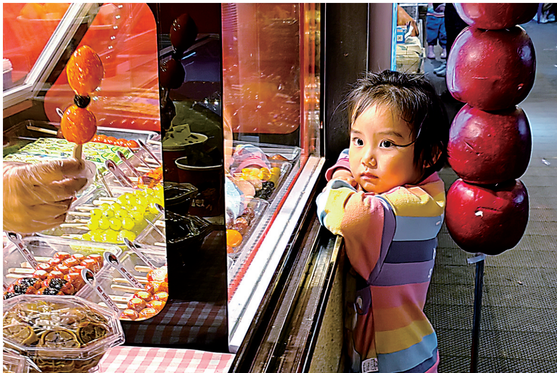
枫林湾小镇买糖葫芦的孩子。 点评:眼神抓拍十分到位。