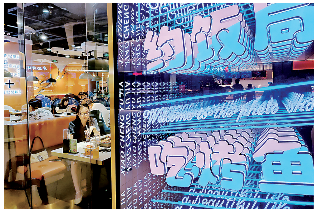
下班了,到闽彩城去吃个饭。点评:前景冲击力强,背景环境交代清楚。