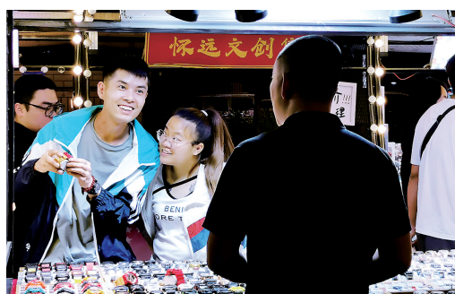
怀远夜市里一对情侣选购心仪的手表。点评:表情丰富,主题明确。