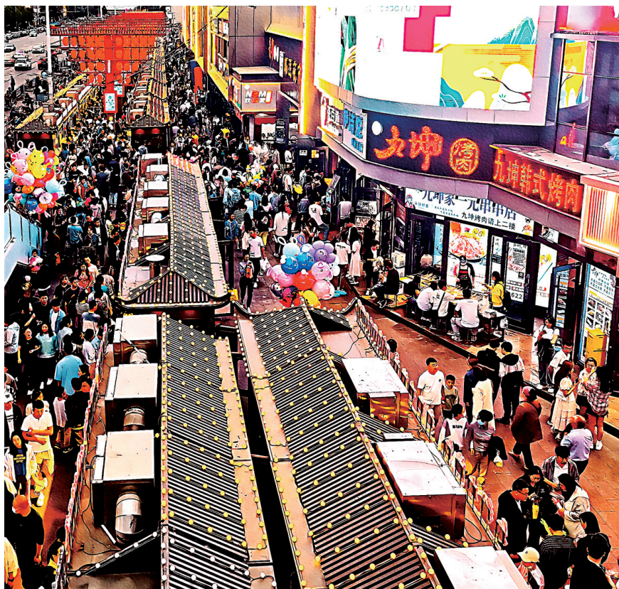
怀远夜市人山人海,叫卖声此起彼伏。@吴荷兰 摄 点评:巧妙的利用建筑形成人潮涌动的拍摄。