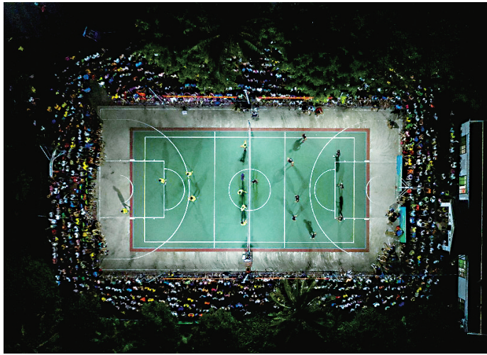
比赛在村里同时具备排球赛、篮球赛综合功能的场地进行。

海南“村排”的火爆和活力，呈现生机勃勃的新农村场景，是乡村振兴不断推进的生动实践，更是农民精神文化生活日益丰富的缩影。