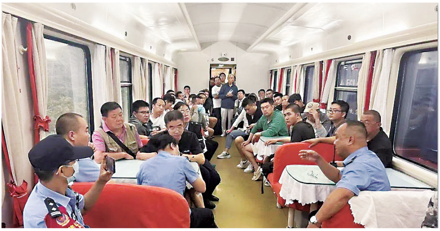
K1178次列车上组织成立临时党支部。