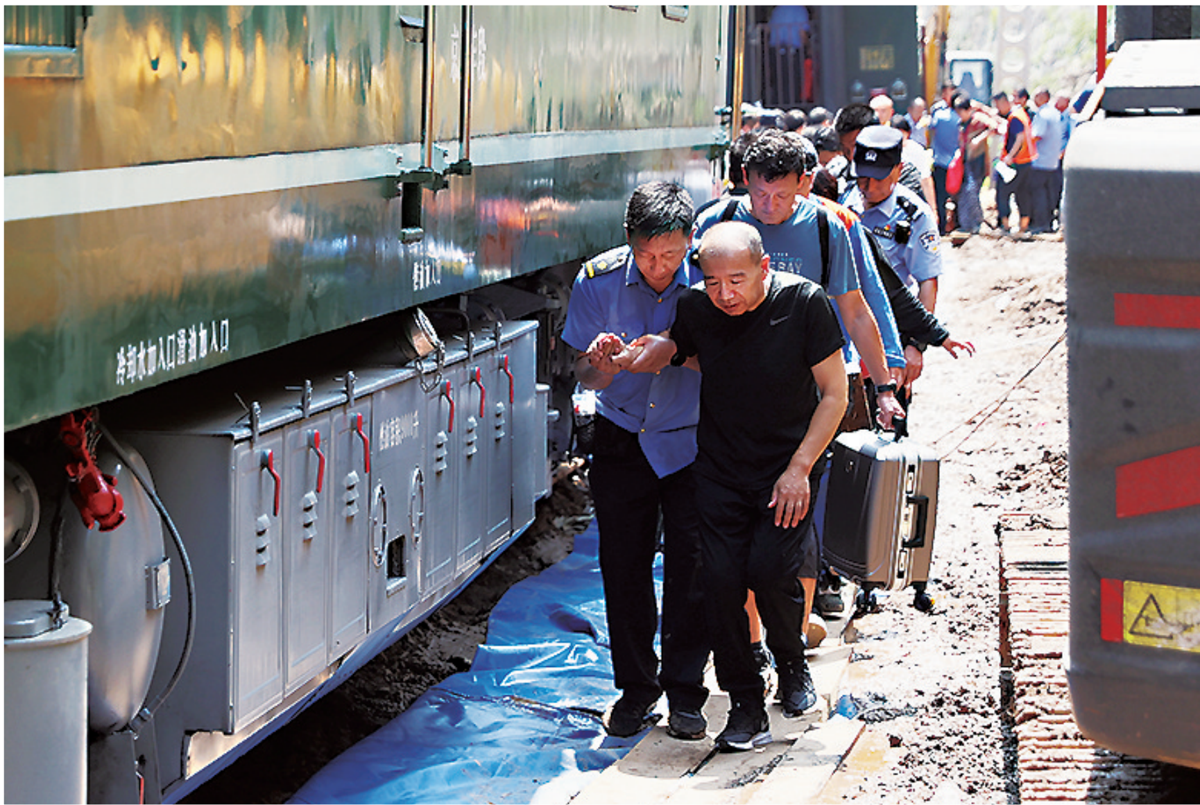
列车乘务人员小心搀扶着老人转移。