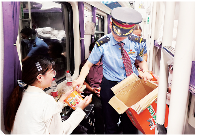
列车乘务人员为旅客发放救援物资。