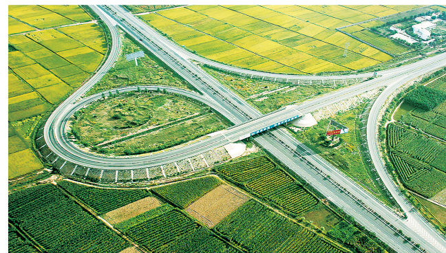
京藏高速四十里店区道桥