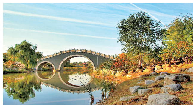
西夏区运动公园拱桥