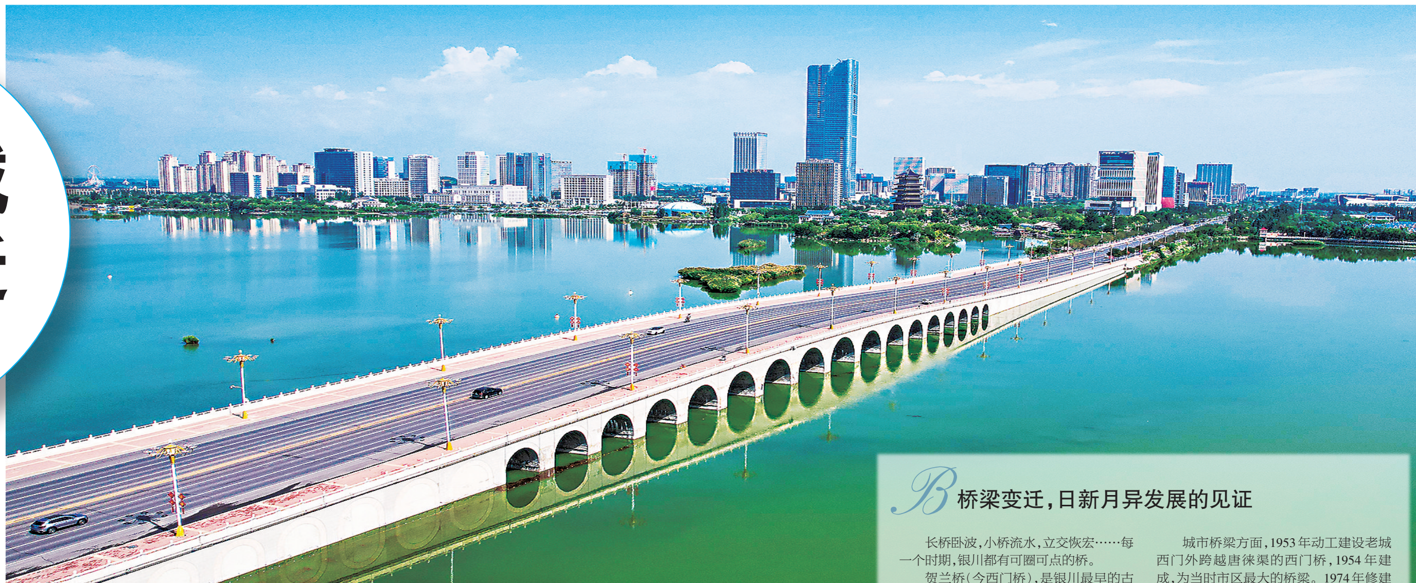
宁安北街十七孔桥

考虑到银川引黄灌区自古以来形成的多渠沟、多湖泊的特点,经过权衡,《银川的桥》编辑部决定以水为脉络,对桥梁进行梳理,这既符合本地特点,脉络也清晰,同时也让本地读者更易懂、更亲切。