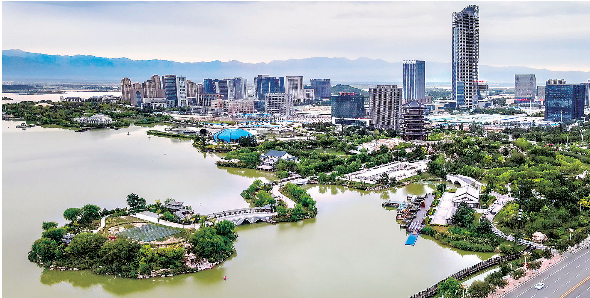
远眺阅海湾中央商务区。本报记者 韩胜利 摄

2022年,银川实现地区生产总值2535.63亿元,同比增长4.0%。“三新”产业产值突破693亿元,增长37%。其中,新材料产业完成产值437.85亿元,占市级规上工业总产值的28%。2023年,宁夏贺兰山东麓葡萄酒品牌价值达到320.22亿元,上升至全国地理标志产区区域品牌榜第8位。银川产区荣获首届中国国际葡萄酒大赛“年度产区奖”,产区知名度和影响力显著提升。