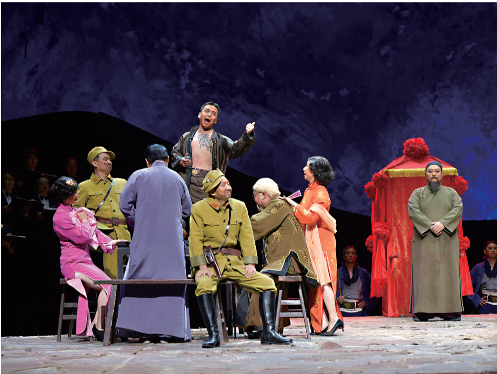
所有演员全身心投入演出。

本报讯（记者 季正）10月24日20时许，在成都四川大剧院，国家艺术基金设立10周年优秀资助剧目汇演节目中，宁夏演艺集团秦腔剧院大型秦腔现代戏《王贵与李香香》精彩上演，现场座无虚席，掌声雷动。 国家艺术基金设立于2013年底，是旨在繁荣艺术创作、打造和推广精品力作、培养艺术人才、推进国家艺术事业高质量发展的公益性基金。9月7日至11月4日，国家艺术基金管理中心开展国家艺术基金设立10周年优秀资助剧目汇演活动。 宁夏秦腔现代戏《王贵与李香香》根据著名诗人李季1946年发表的同名叙事长诗改编而来。该剧以一对红色恋人的爱情故事为线索，展现了“三边”人民的革命历程。王贵革命信念坚定，李香香性格坚贞，这两名敢于反抗、争取自由和幸福的农村青年是整部剧的灵魂人物。该剧曾荣获“文华大