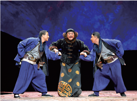
演员精湛的演技，赢得阵阵掌声。

本报讯（记者 季正）10月24日20时许，在成都四川大剧院，国家艺术基金设立10周年优秀资助剧目汇演节目中，宁夏演艺集团秦腔剧院大型秦腔现代戏《王贵与李香香》精彩上演，现场座无虚席，掌声雷动。 国家艺术基金设立于2013年底，是旨在繁荣艺术创作、打造和推广精品力作、培养艺术人才、推进国家艺术事业高质量发展的公益性基金。9月7日至11月4日，国家艺术基金管理中心开展国家艺术基金设立10周年优秀资助剧目汇演活动。 宁夏秦腔现代戏《王贵与李香香》根据著名诗人李季1946年发表的同名叙事长诗改编而来。该剧以一对红色恋人的爱情故事为线索，展现了“三边”人民的革命历程。王贵革命信念坚定，李香香性格坚贞，这两名敢于反抗、争取自由和幸福的农村青年是整部剧的灵魂人物。该剧曾荣获“文华大