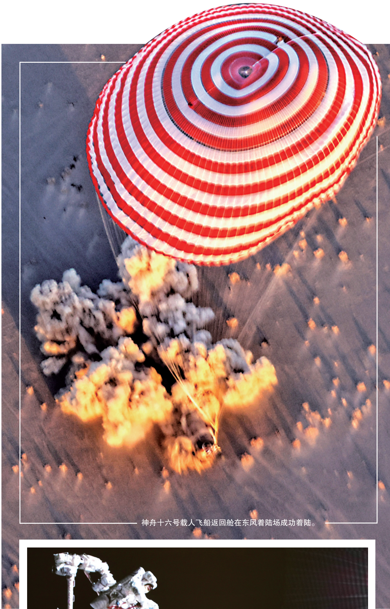
神舟十六号载人飞船返回舱在东风着陆场成功着陆。

3名航天员抵京后将进入隔离恢复期,接受全面的医学检查和健康评估,并进行休养。之后,他们将在京与新闻媒体集体见面。