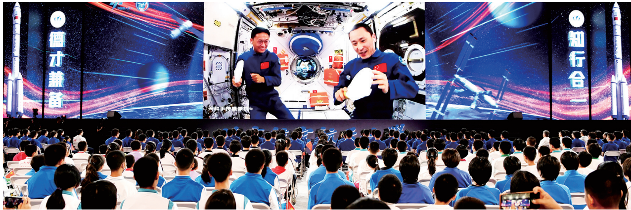
2023年9月21日,在北京航空航天大学,学生收看“天宫课堂”第四课。