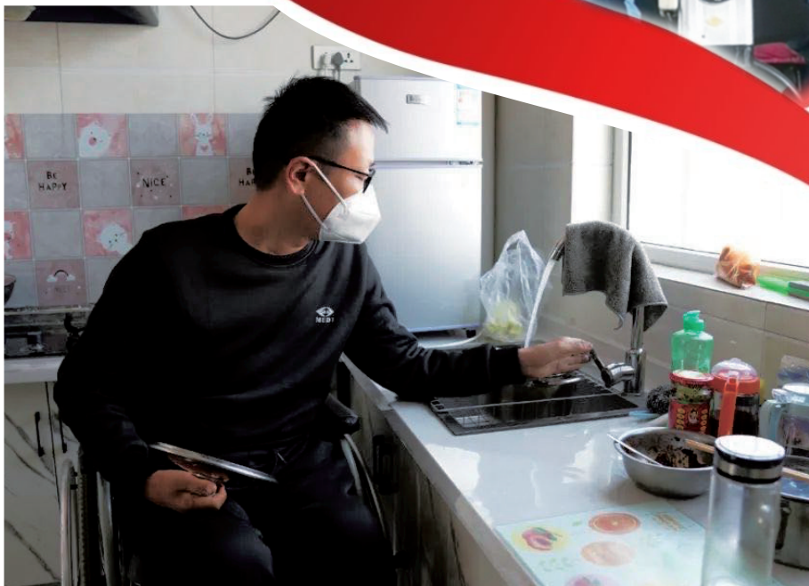
厨房安装低位灶台后，就可以自己动手做饭了。