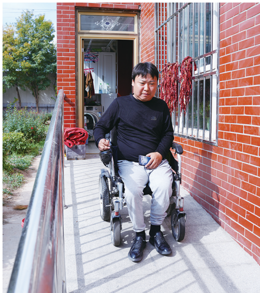
进行坡道改造后，轮椅“畅通无阻”。