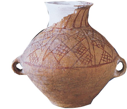
菜园遗址瓦罐嘴墓地出土的双耳彩陶壶。