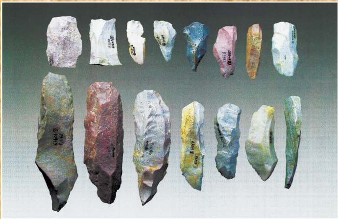
水洞沟第1地点出土的石叶。