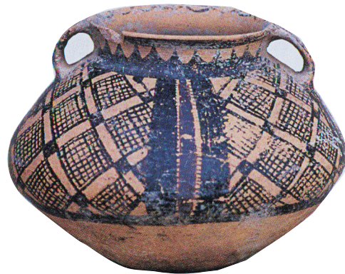
菜园遗址瓦罐嘴墓地出土的双耳彩陶罐。

火塘遗迹和疑似柱洞的建筑类遗迹的发现，对于研究旧石器时代末期人类的居址形态和生存模式有重要意义。出土较多鸵鸟蛋皮装饰品和复杂纹饰鹿牙装饰品，反映出万年前精巧的钻孔工艺技术和极致艺术追求。发现的上千件磨盘/磨棒，为西北地区农业起源研究提供了丰富的材料。鸽子山遗址曾入选“2016年度全国十大考古新发现”，获得“2017年田野考古发掘一等奖”。