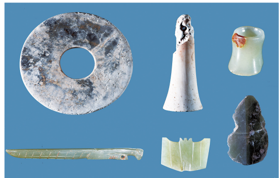
姚河塬遗址出土的玉器。