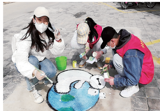
西夏区朔方路街道宁大社区联合大学生开展创意井盖涂鸦活动。