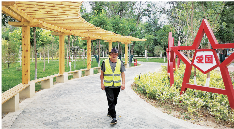
小微公园——西夏区红领巾公园。