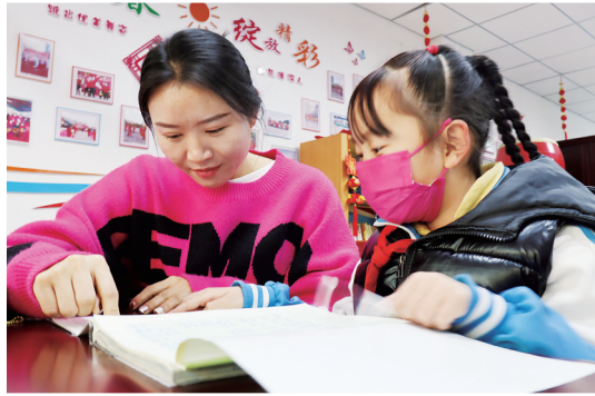
孩子在永宁县望远镇西位社区两点半课堂学习。