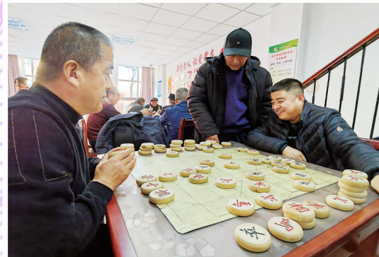
居民在永宁县望远镇西位社区老年活动室下棋。