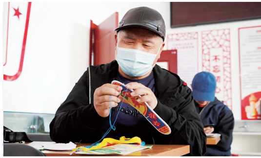
在西夏区兴洲苑社区新时代文明实践站,老人学习刺绣。