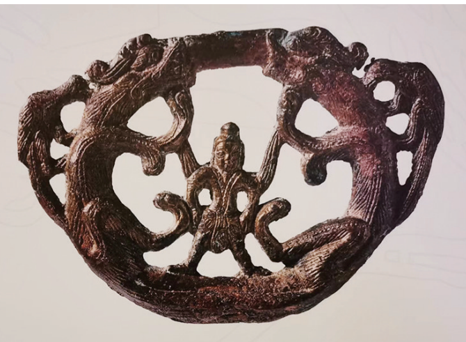
北魏透雕铜牌饰(宁夏固原博物馆)。资料图片