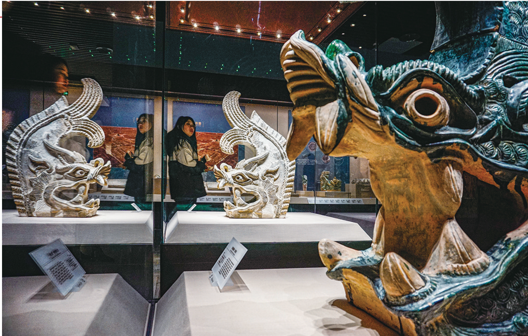
灰陶鸱吻和琉璃鸱吻。

宁夏博物馆里究竟藏着多少条龙？有兴趣的朋友不妨好好找寻一番，一定会有不少惊喜的发现。