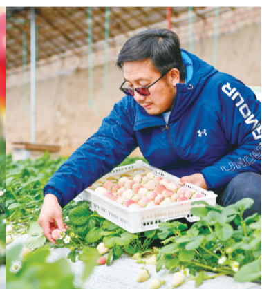
“初恋的味道”(白草莓)是最新从日本引进的品种。