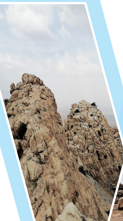
贺兰山滚钟口笔架山。