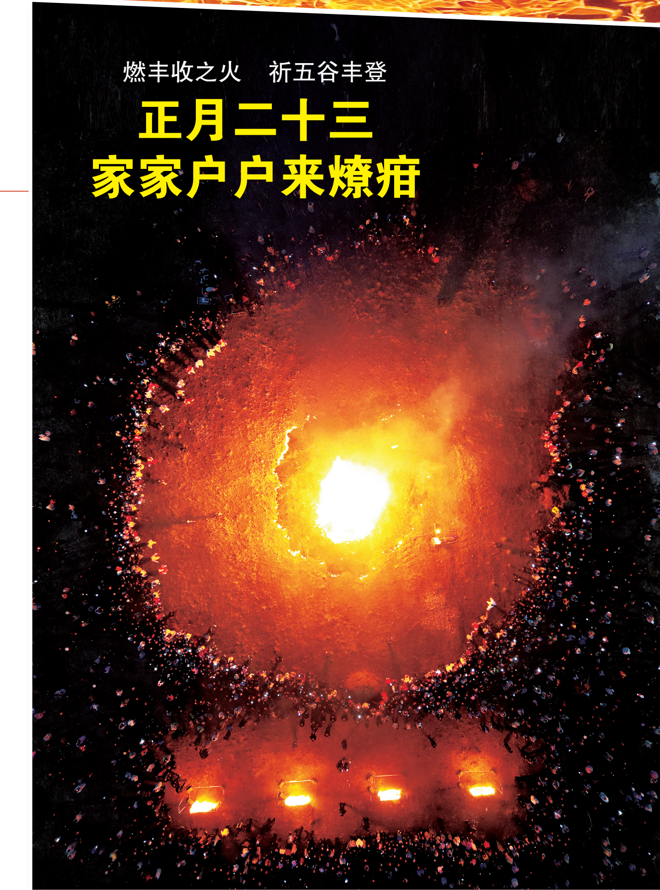
隆德县文化馆工作人员带领大家跳起欢快的圆圈舞。

“截至目前,隆德县游客接待量达32.2万人次,实现服务业社会总收入1.16亿元。其中,2024年‘在宁夏·非遇过大年’文旅系列活动游客接待量达20.6万余人次,实现服务业社会总收入0.74亿元。”隆德县相关部门负责人介绍,活动期间隆德县游客爆棚,宾馆、民宿等人住率有的达到100%,餐饮就座率达90%以上,农副特产销售、文创产品、年货小吃等销售额直线上升。