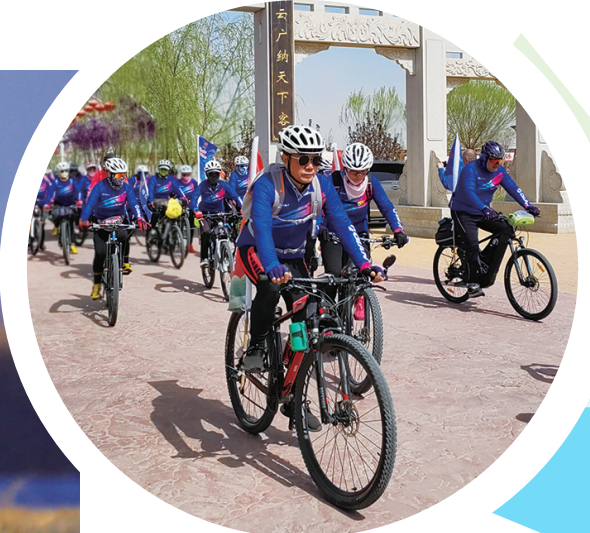
骑行爱好者在银河湾骑行。