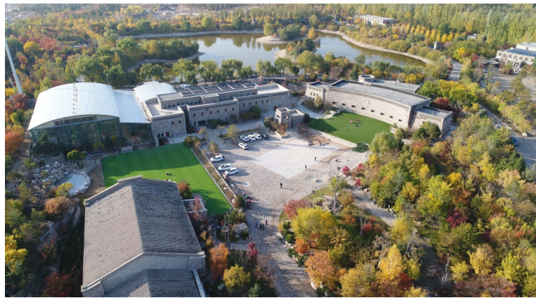
贺兰山运动公园美景如画。