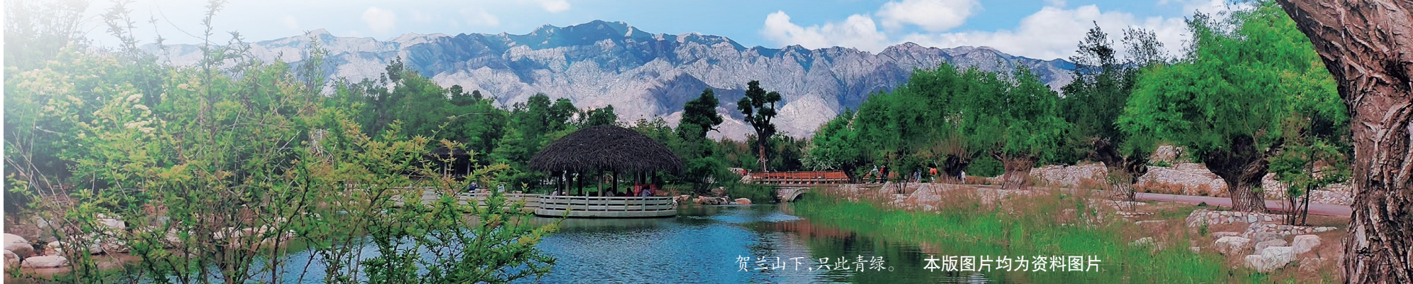
贺兰山下,此青绿。

人不负青山,青山定不负人。这里经过生态恢复治理后变成一个绿色公园,并通过发展葡萄酒产业推动文化、旅游、体育、康养等多种融合发展,实现了生态治理和经济转型。