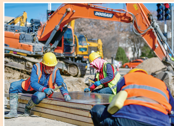
工作人员正在进行管道池壁模板订制工作。