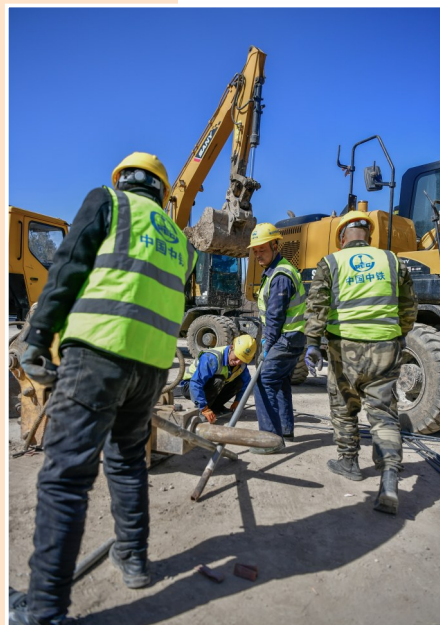
施工人员更换设备。