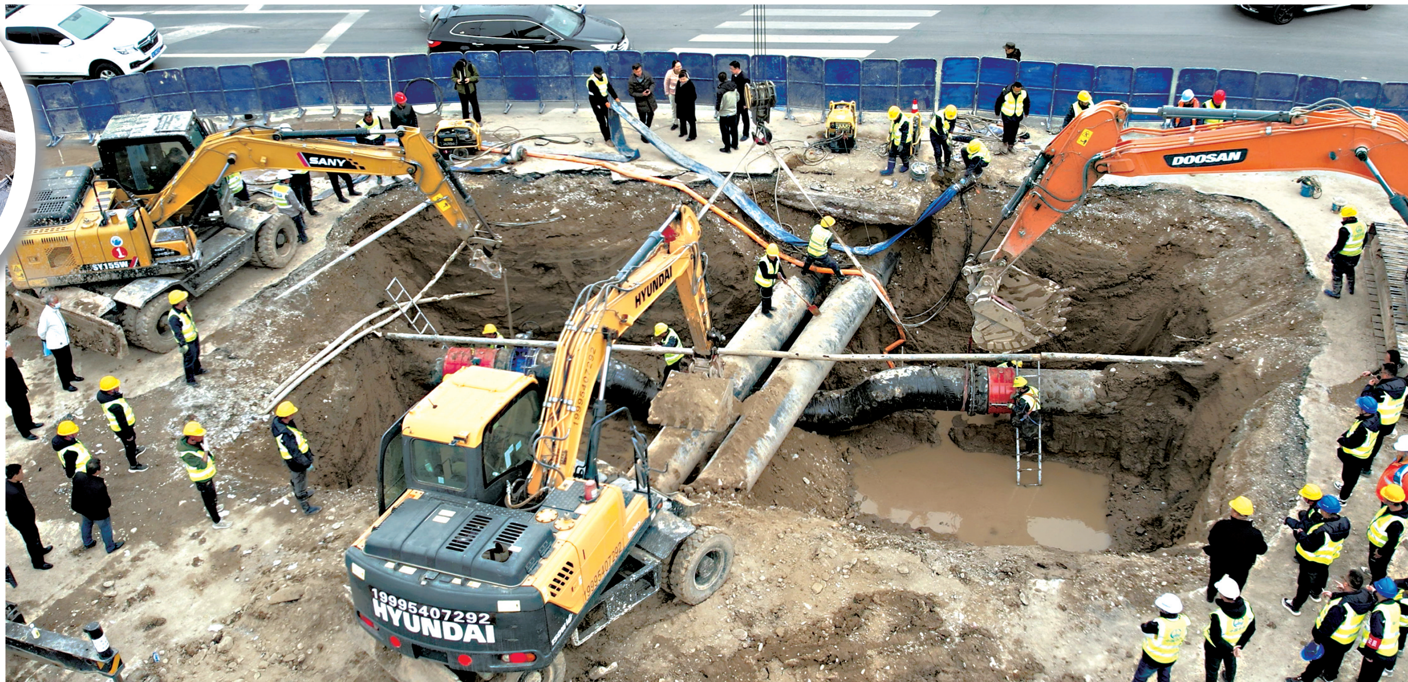
3月17日14时20分,新旧管道顺利闭合,管道抢修结束。