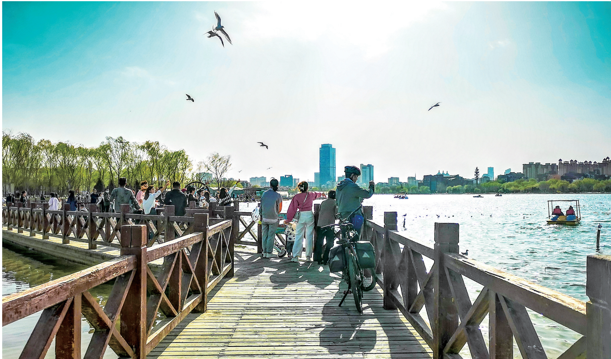
银川北塔湖春光正好。