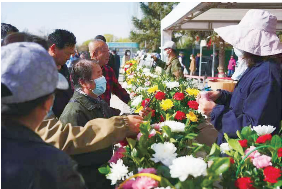
如今,越来越多人用鲜花祭奠故人。