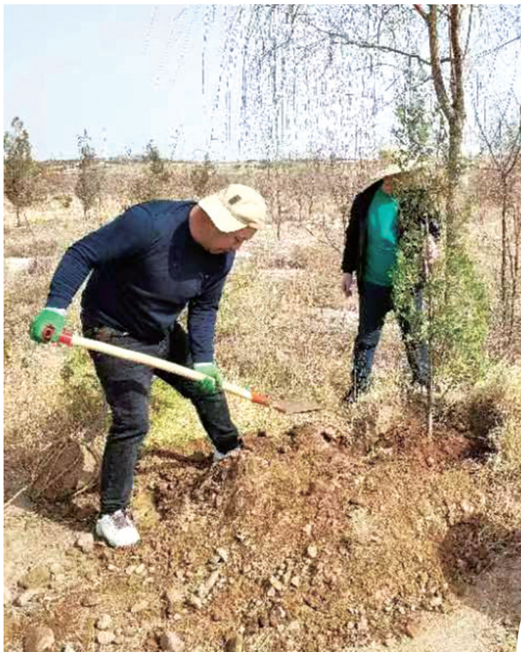
灵武市政府推出的“植树寄哀思”活动已开展两年。

烧纸香烛换取树苗植绿。一年过去,一株株侧柏身姿挺拔,为墓区带来点点新绿。 今年,灵武市持续投资18万元,采购侧柏树苗6000株,并从运输、种植、灌溉、养护等方面提供全程免费服务。目前,已有5000余株树苗被认领栽植。