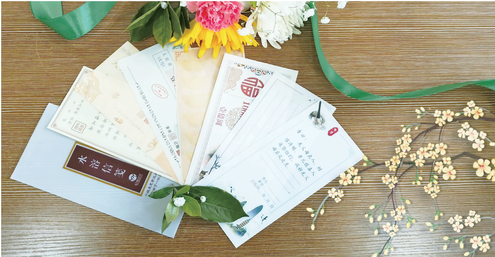
用“水溶信箋”寄托哀思,这是银川市今年推出的新型祭奠方式。