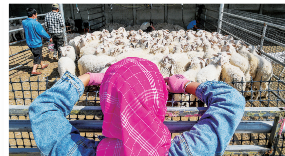
金山羊是金山村产业的“金字招牌”。