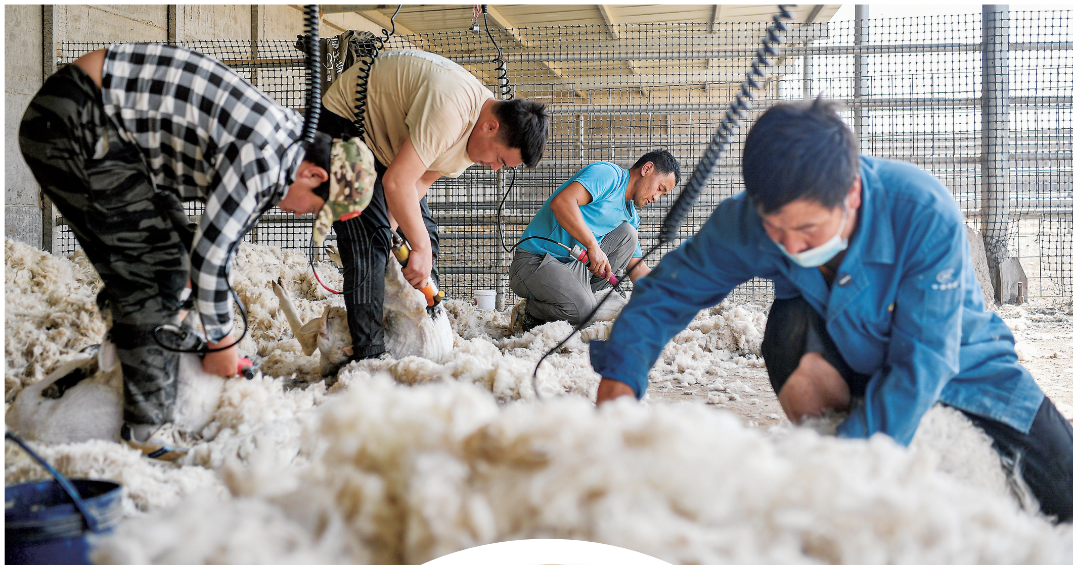
在金山村养殖区,工人们剪羊毛、抓羊绒,一派忙碌景象。