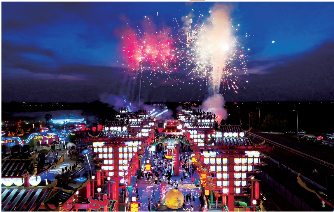
沙湖不夜城灯光璀璨。