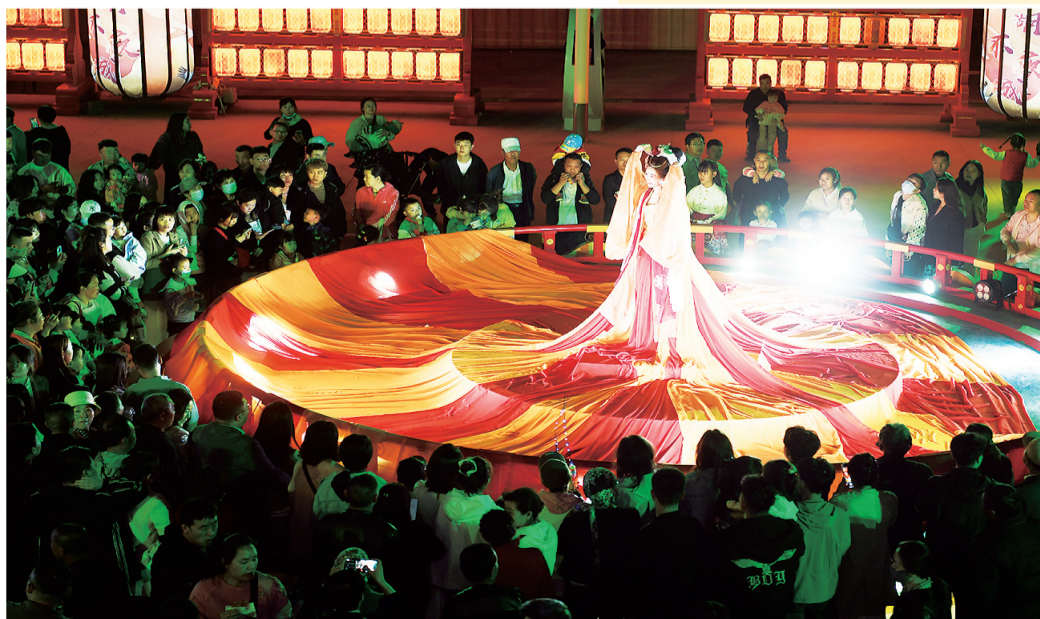
精彩的大唐风演绎。

今年五一小长假,宁夏旅游又火爆起来了。在沙湖旅游景区,沙湖不夜城重磅回归,精彩的演出、奇幻的景观、丰富的美食等让万千游客流连忘返。