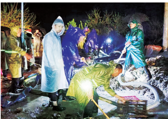
李俊镇干部连夜抽排道路积水。

4台挖掘机开挖出一条排水沟,尽力把积水排到附近泄洪渠。但这远远不够。随后,银川市调集的水泵到位,齐刷刷开足马力将水抽排到附近的葡萄园,机器的轰鸣声响彻夜空。