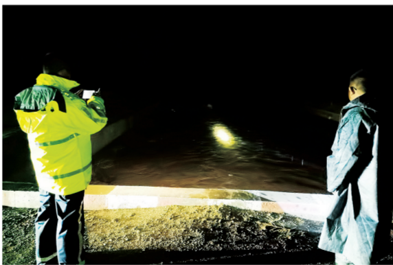
李俊镇干部查看泄洪沟水情。