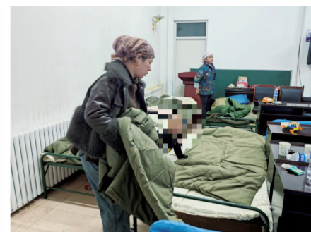
安置点准备好了被褥。