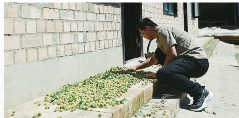
明健翻晒刚摘的山桃。