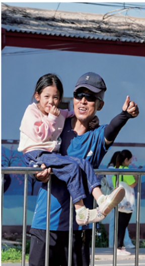
场外观众为选手竖起大拇指。

来自梧桐树乡河忠堡村的跑团由17人组成，为了能在“村跑”取得好成绩，他们提前集训。只要团长说一声“走，跑步走”，他们会迅速给玉米地锄完草、从菜地摘完菜、关上店铺门，开始集体训练。“农民更需要锻炼，有了好身体，才有精力干更多事情。这次恰逢在家门口办‘村跑’，我们肯定要参加啊！”河忠堡村党支部书记孙军说。