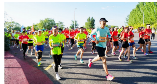
在最美赛道上奋力奔跑。