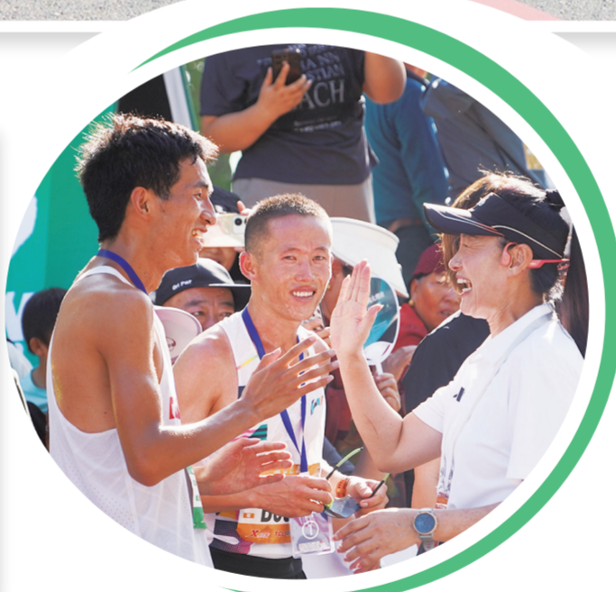
马拉松世界冠军孙英杰(右一)与获奖选手击掌。