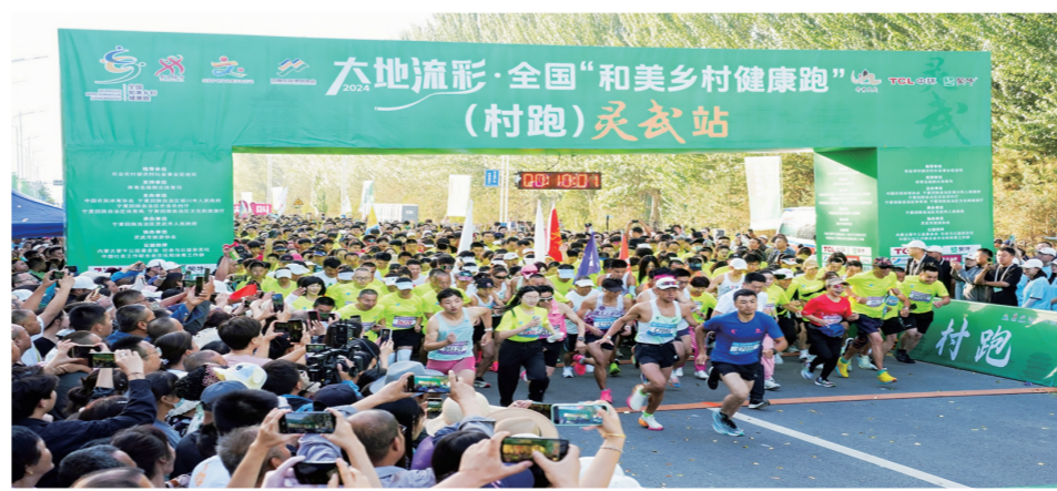
发令声响起，选手们冲出起跑线。