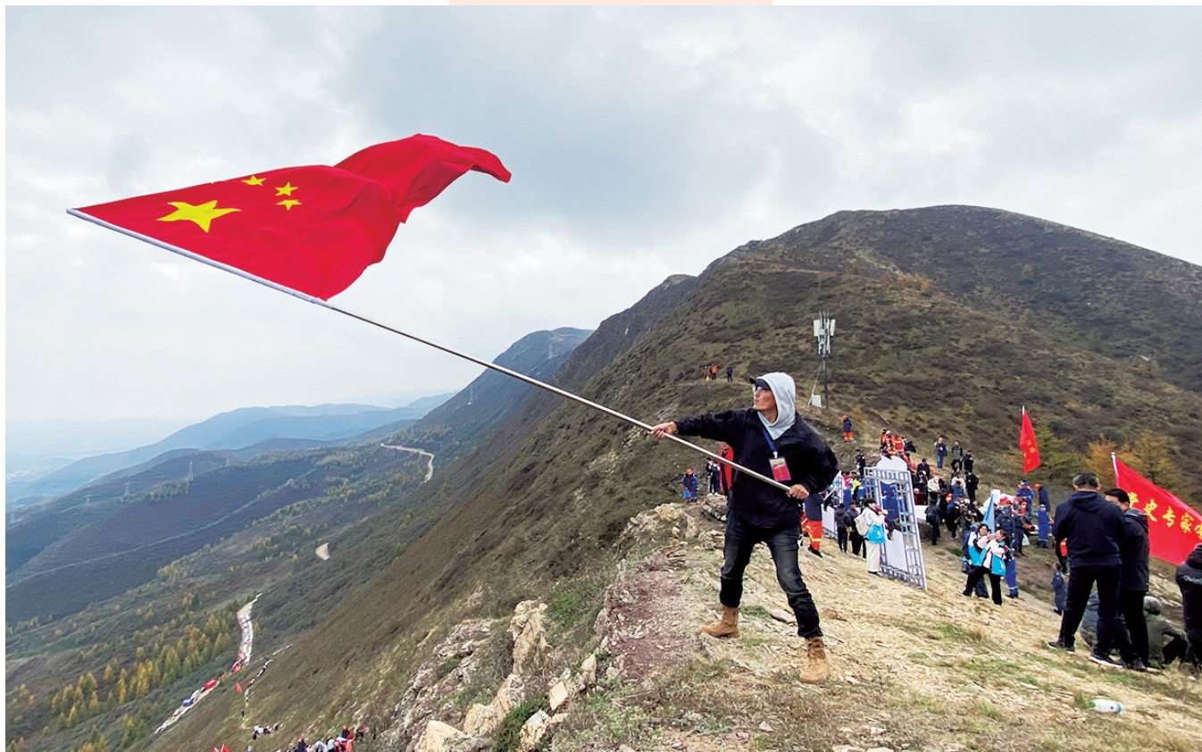
重走长征路，翻越六盘山。