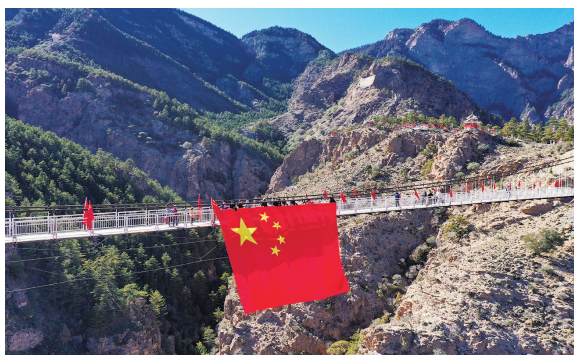
贺兰山上，五星红旗格外醒目。