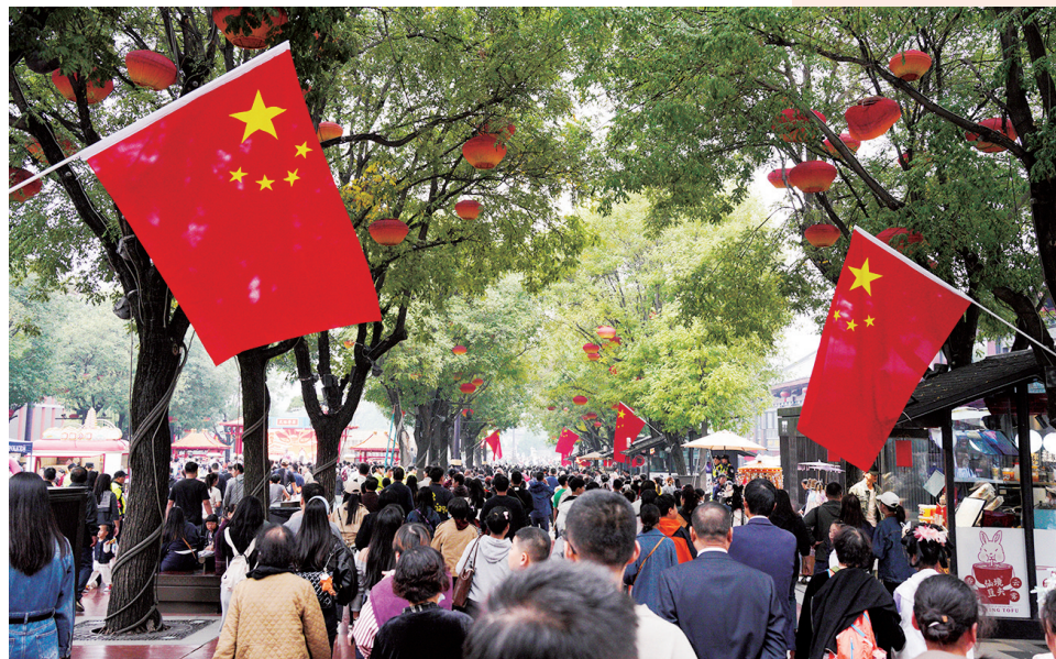
国旗在大街小巷飘扬。

国庆假期，祖国大地处处洋溢着喜庆的节日氛围，本栏目收到不少摄影爱好者拍摄的作品。从繁华的都市到风光优美的景区，目光所及，皆是那一抹鲜艳的红色——五星红旗。