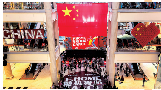
国庆假期，商场里处处洋溢着喜庆的节日氛围。

五星红旗不仅是一面旗帜，更是一种精神传承，激励着每一位中华儿女为实现中华民族伟大复兴的中国梦而努力奋斗。让我们在飘扬的红旗，共同祝愿伟大祖国繁荣昌盛。