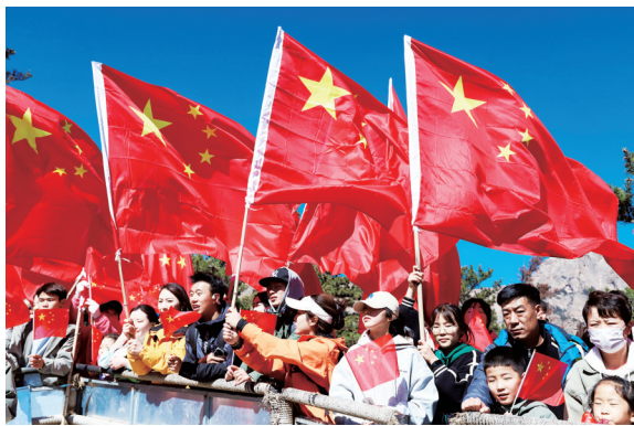
高举红旗，为新中国庆生。