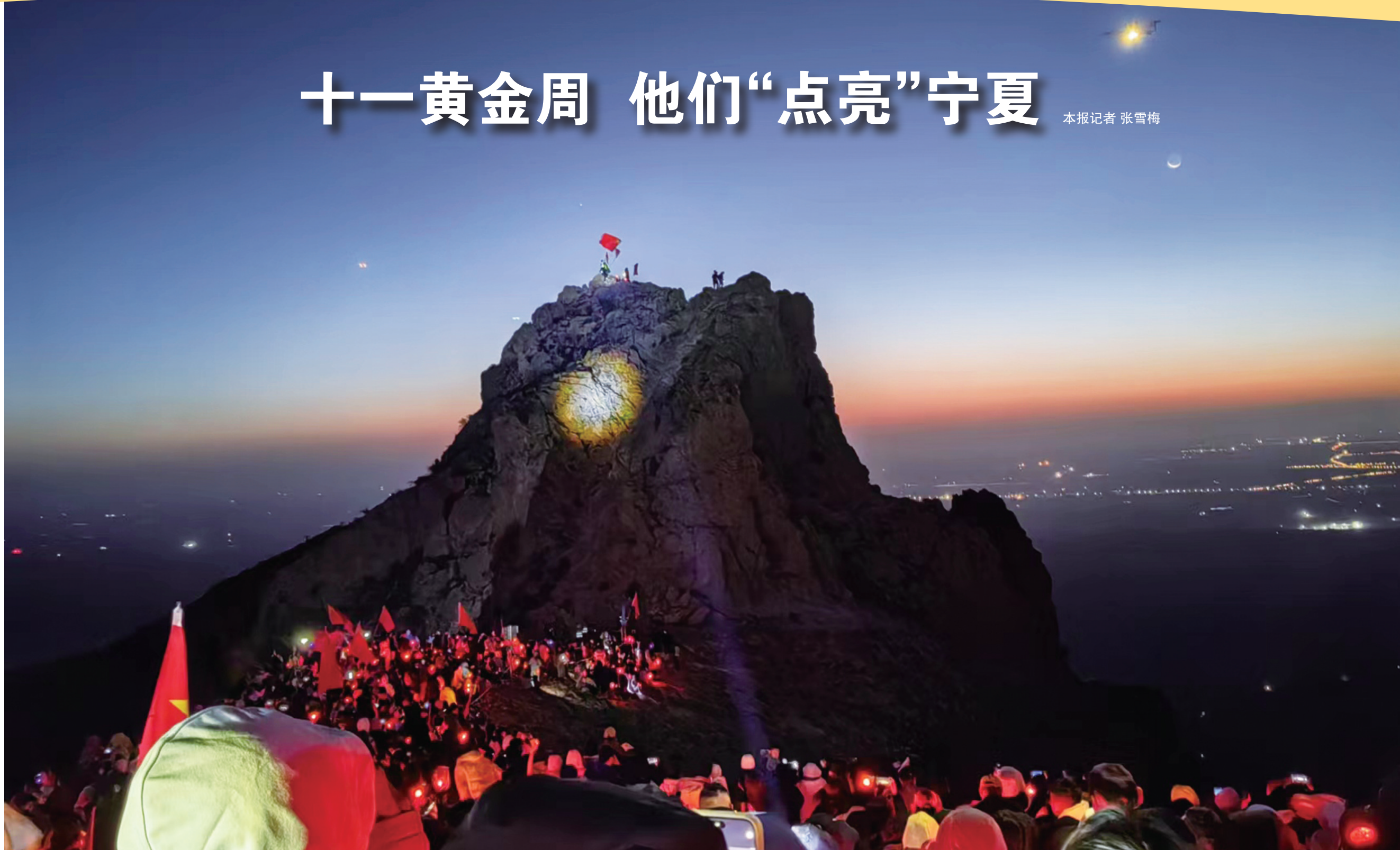
当五星红旗在山顶高高飘扬,贺兰山沸腾了。