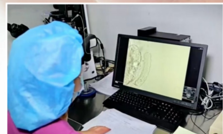
实施辅助孵化,类似于小鸡孵出蛋壳的过程。