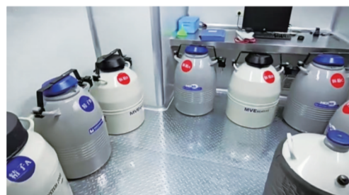
胚胎冷冻间冻存着4万个胚胎。

宁夏医科大学总医院生殖医学中心自落实该政策以来,已经有50多位患者享受到了实惠。