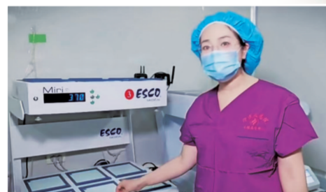
胚胎培养室的培养箱,模拟子宫的环境。