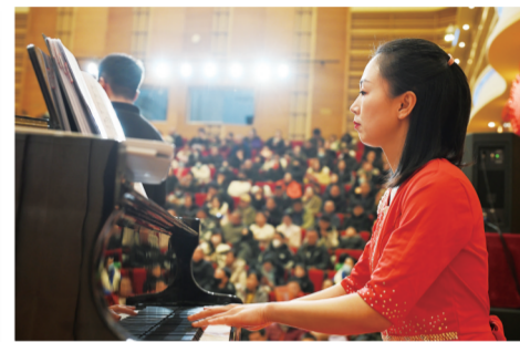
在优美的音乐声中,迎接新的一年。