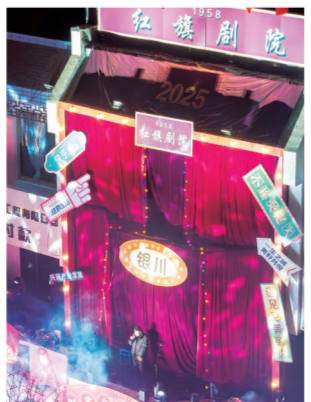
在时光音乐舞台上歌唱。