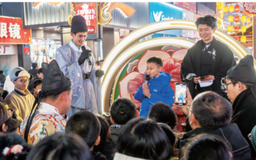
在对诗、投壶等游戏中,体验传统文化的魅力。