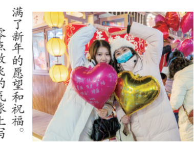
满了新年的愿望和祝福,零点放飞的气球上写上