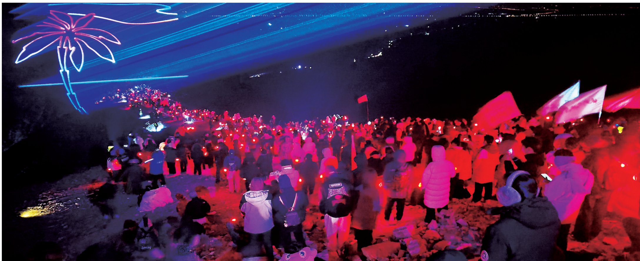
人们在贺兰山笔架峰上欣赏灯光秀。