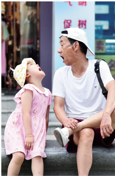
“爷爷,我比你的声音大。”