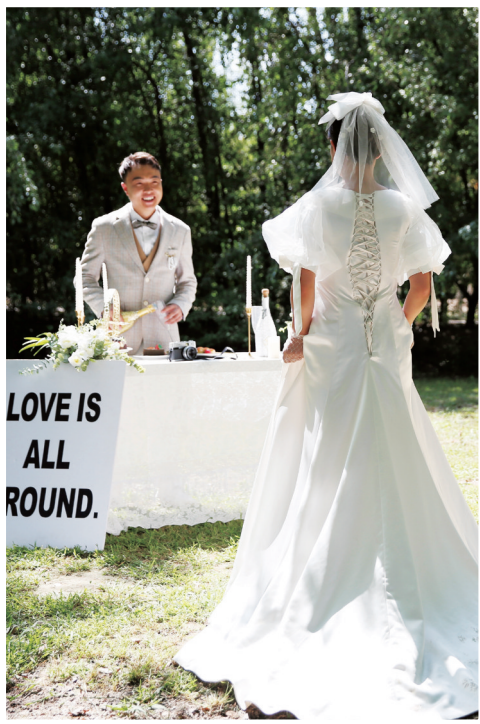
“今天起,我们一定要幸福啊!”