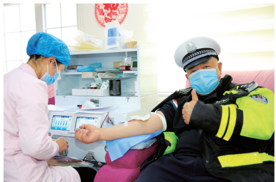
无偿献血,以涓涓热血汇成拳拳爱心。