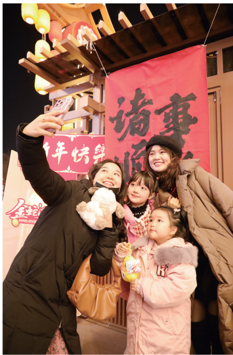
合影留念,笑容满满。