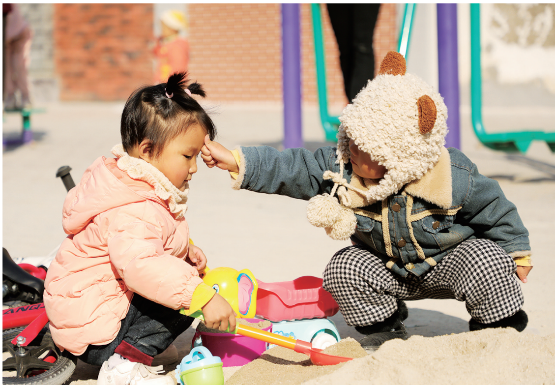
“给你点个大大的赞。”

本栏目将陆续推出个人专题作品,有意者请微信联系(nxyizhi),投稿邮箱125790058@qq.com。