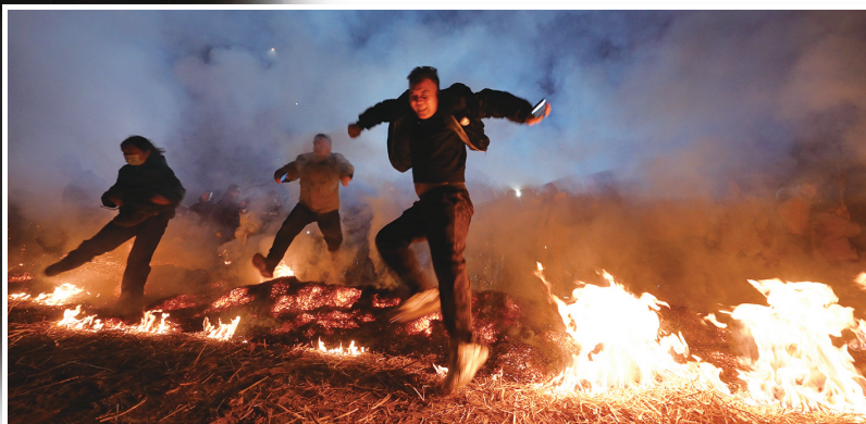
群众纵情跨过火堆。