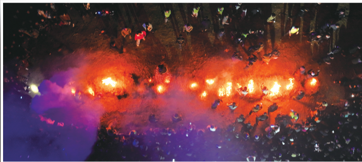
燎疳深受人们喜爱。