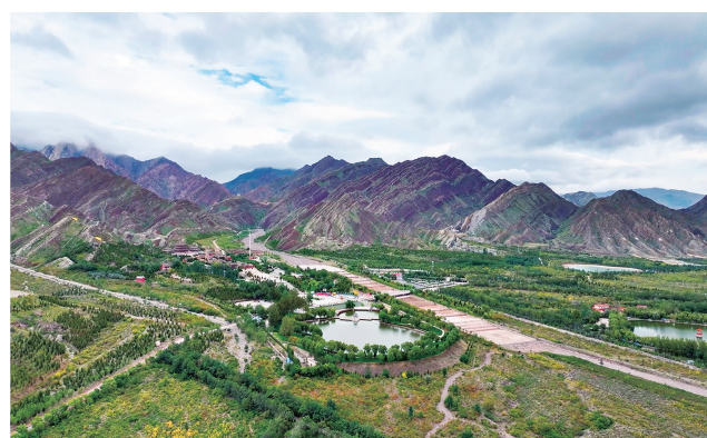
贺兰山巍峨耸立,守护着石嘴山。