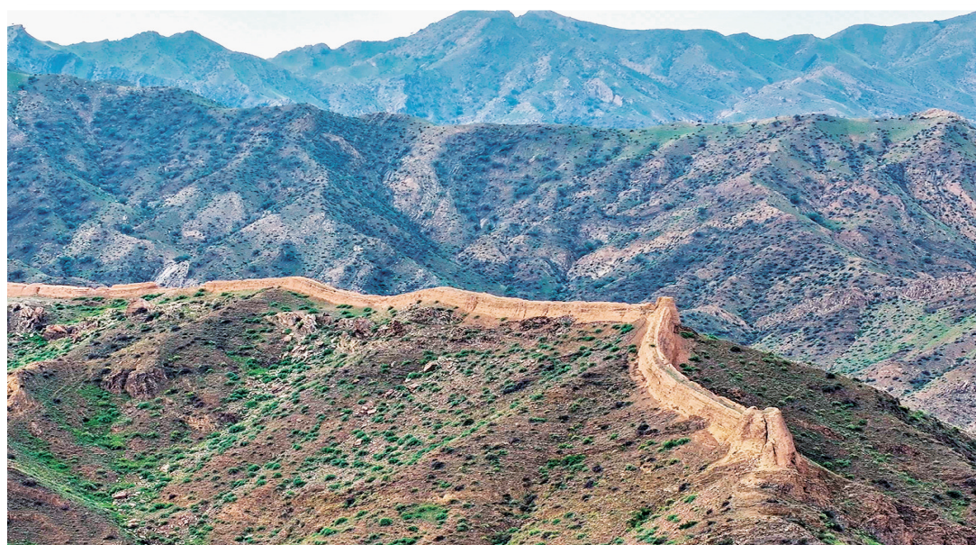
长城作为古代军事防御工程,历经风雨,依然耸立在山间。