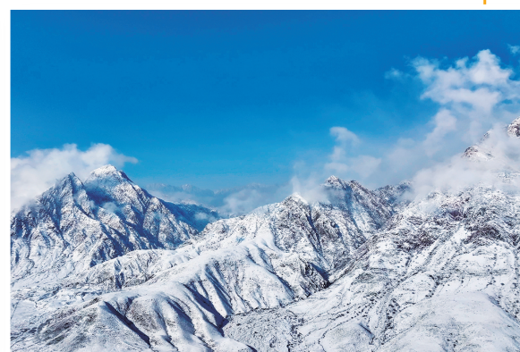
雪后的贺兰山,宛如被大自然精心雕琢的冰雪世界。